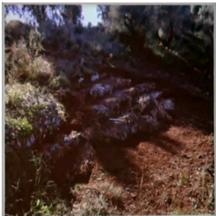
Εδώλια του θεάτρου