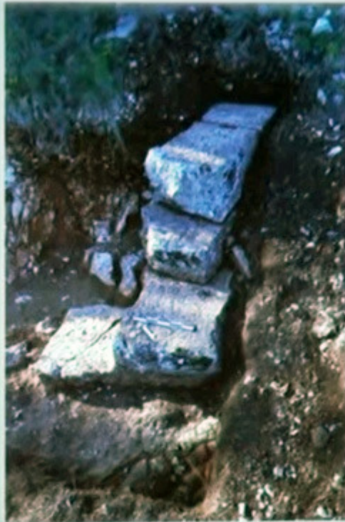
Τμήμα αναλημματικού τοίχου στα δυτικά του κοίλου

Τέλος, στο δυτικότερο άκρο του επίπεδου πλατώματος όπου ήταν ορατό τμήμα τοίχου, διαπιστώθηκε ότι αυτός ο τοίχος έχει μήκος 3μ και πλάτος 80 εκ. είναι χτισμένος ισοδομικά, με επεξεργασμένους ογκόλιθους και είναι ορατές 4 σειρές δόμων ύψους περίπου 1,5 μέτρο. Οι 3 ανώτεροι δόμοι έχουν κατεύθυνση σχεδόν βορά- νότου ενώ ο τέταρτος είναι τοποθετημένος με κατεύθυνση ανατολή- δύση, σχηματίζει δηλαδή γωνία. Λόγω της θέσης του είναι πολύ πιθανό να πρόκειται για αναλημματικούς τοίχους του κοίλου, στα δυτικά και βόρεια και επομένως με σχετική επιφύλαξη μπορούμε να τοποθετήσουμε βόρεια αυτών των τοίχων, μπροστά δηλαδή στη διαφάνεια που βλέπουμε τη μία πάροδο.