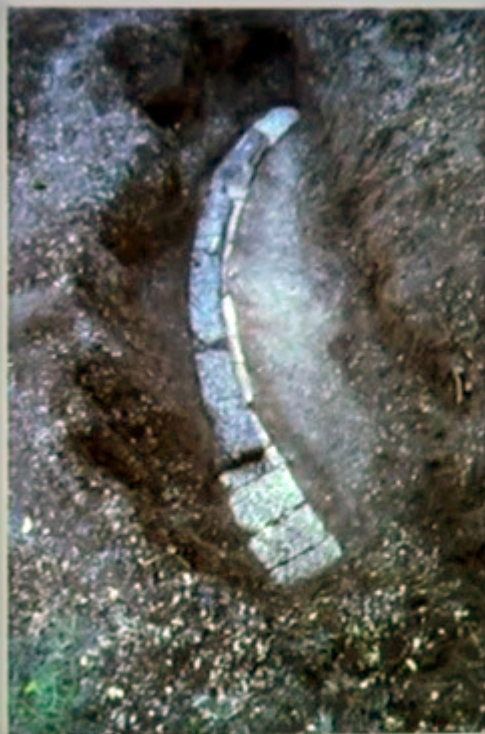
Τμήμα της ορχήστρας

Από τις τομές που έγιναν στο επίπεδο πλάτωμα του ακινήτου εντοπίστηκε τμήμα της ορχήστρας. Αυτό είναι ένα εξαιρετικά σημαντικό τμήματα για εμάς. Εφόσον εντοπίστηκε τμήμα τοίχου σε κάτοψη τεταρτημορίου.